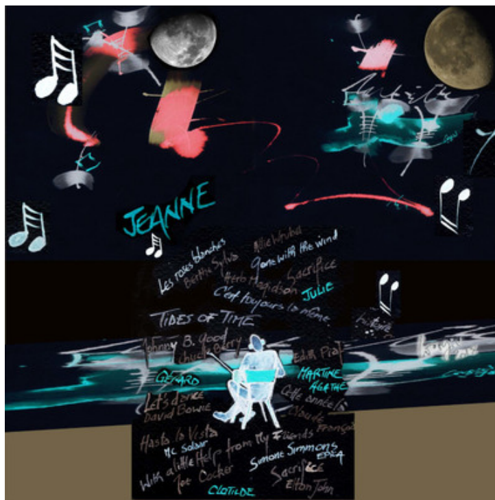
Illustration : Corine Sylvia Congiu - 2019

L'homme contemplait l'océan avancer dans sa direction en rouleaux bleutés écumants puis reculer, inlassablement. Les pieds de sa chaise pliante enfoncés dans le sable humide et brun, cependant que le soleil déclinait déjà, il écoutait de la musique. L'air se rafraîchissait et les derniers rayons de l'astre du jour couvraient la grève d'un fin manteau argenté et scintillant. Sur sa gauche, la petite cabane de pêcheur qu'il avait acquise peu après le décès de son épouse demeurait silencieuse et seuls le murmure des eaux et les cris de quelque oiseau égaré au-dessus de sa tête troublaient la quiétude des lieux.