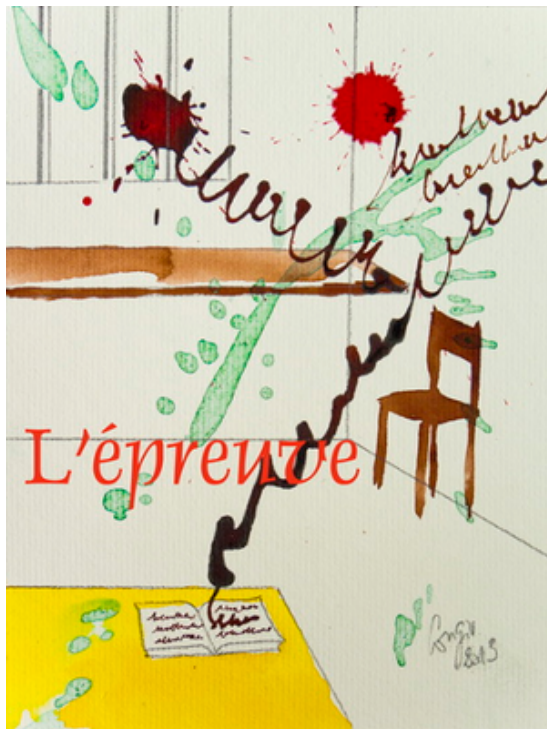
Illustration : Corine Sylvia Congiu - 2013

« Nous allons voir ce que nous allons voir », dirent-ils. Et ils le poussèrent sans ménagement dans la prison, les mains encore liées dans le dos, vêtu en tout et pour tout d'une sorte de pyjama et d'une paire d'espadrilles.